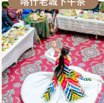
慢品維式甜茶與茶點