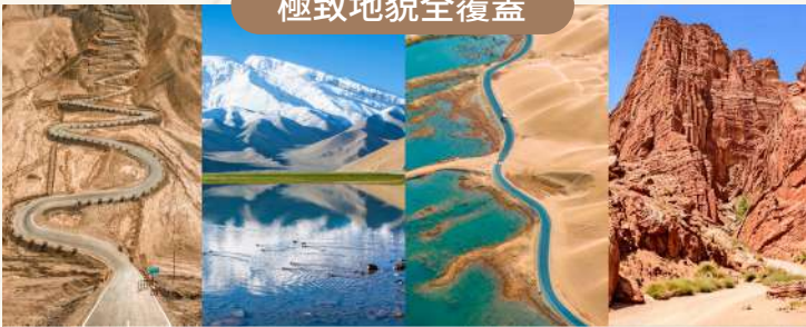
盡覽雪山、沙漠、峽谷、湖泊之地貌史詩！