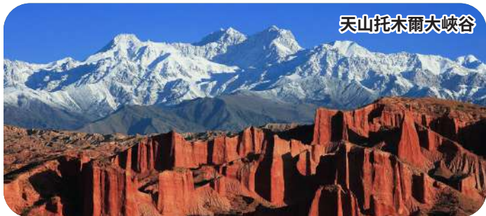
天山托木爾大峽谷