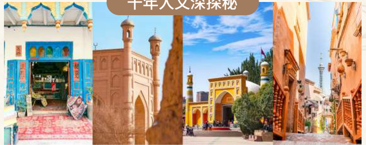
觸摸古絲綢之路的繁華印記！