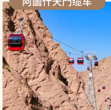
纜車輕鬆登頂，無需徒步