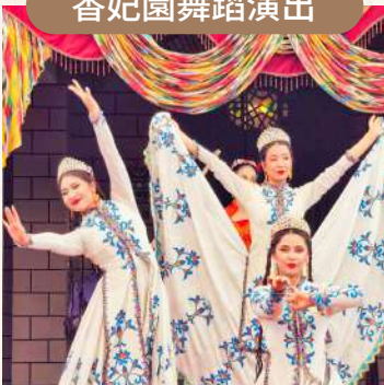
歷史再現，歌舞迎賓