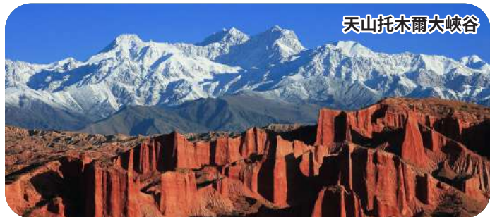
天山托木爾大峽谷