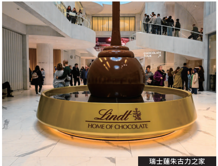
瑞士蓮朱古力之家