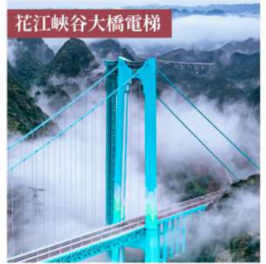
花江峽谷大橋電梯