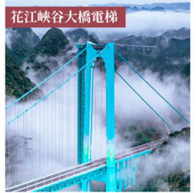
花江峽谷大橋電梯