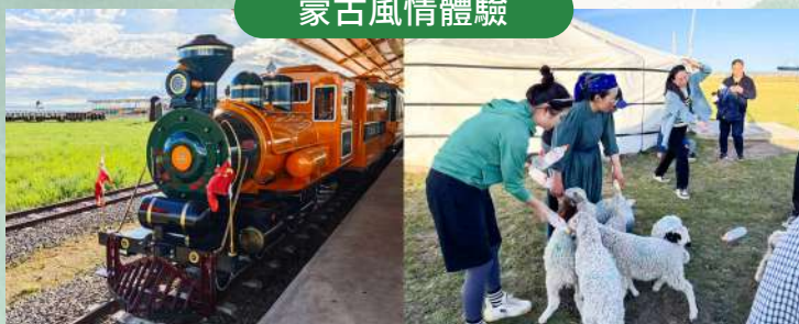
草原小火車體驗 & 牧民家訪深度互動