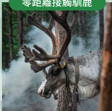
敖魯古雅使鹿部落馴鹿互動