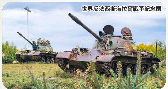
世界反法西斯海拉爾戰爭紀念園