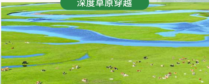
沉浸式感受「天蒼蒼野茫茫」的壯闊!