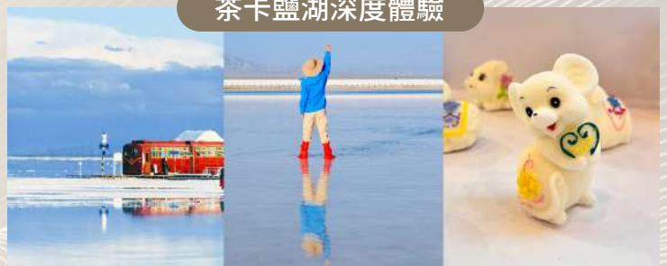
乘小火車深入湖心，穿紅鞋套拍「天空之鏡」倒影，贈生肖鹽雕