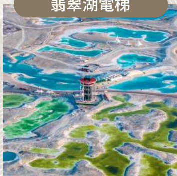
電梯直達觀景臺賞三色湖群