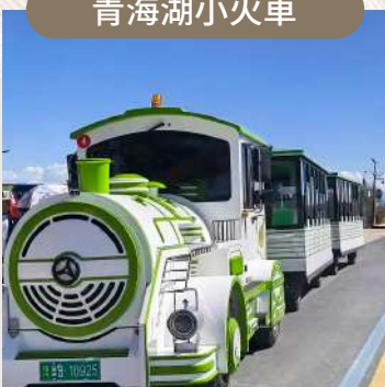
乘小火車，賞「高原藍寶石」