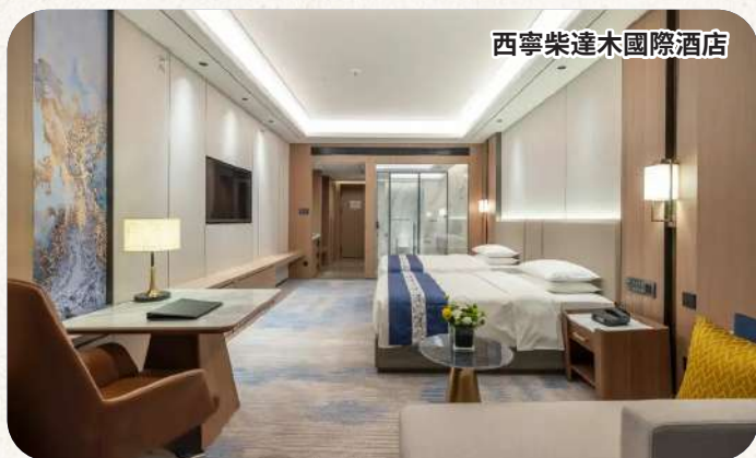
西寧柴達木國際酒店