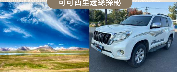
乘越野車探秘可可西里，靈活應對高原路況