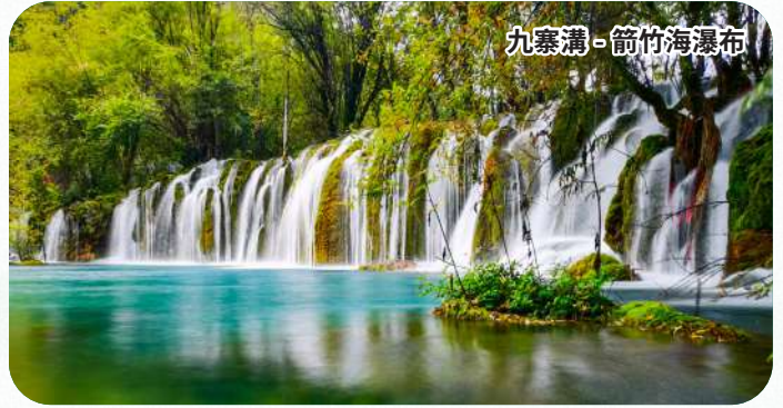
九寨溝-箭竹海瀑布