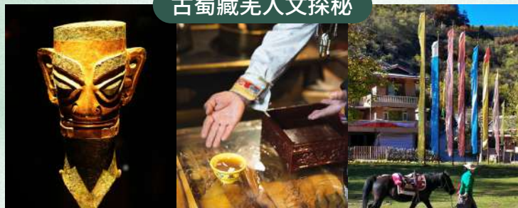
觸摸古蜀文明的繁華印記！