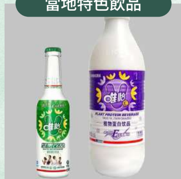
四川飲品唯怡豆奶