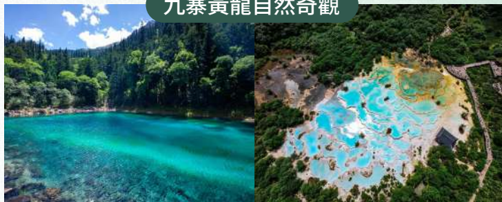
盡覽翠湖、疊瀑、彩林、雪峰、瑤池之地貌史詩！