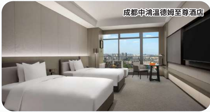
成都中鴻溫德姆至尊酒店