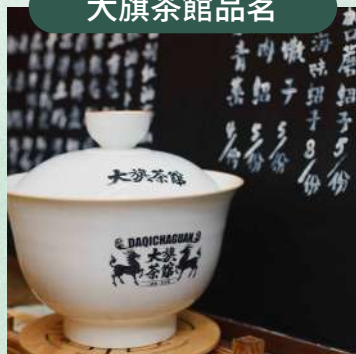
品味老成都的煙火人間