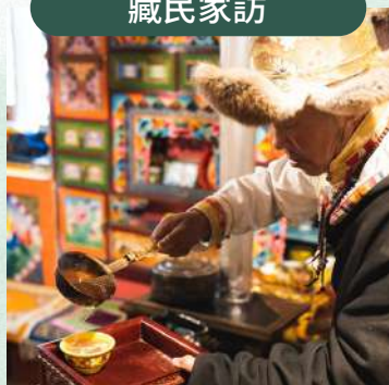
細聽村民講述秘境傳奇