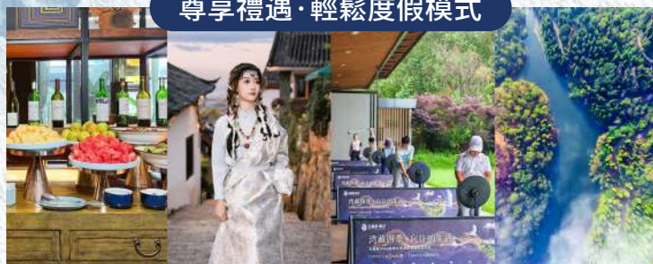
雪山下午茶、古城換裝旅拍、高爾夫揮桿體驗、森林輕徒步