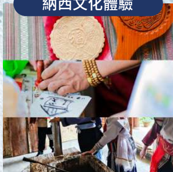
喜餅 / 東巴文 / 造紙術