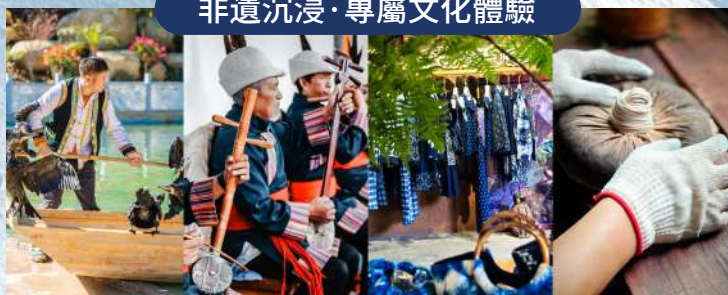
魚鷹捕魚、《白沙細樂》演奏、納西紮染、普洱茶壓製體驗。