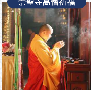
贈送開光結緣福袋