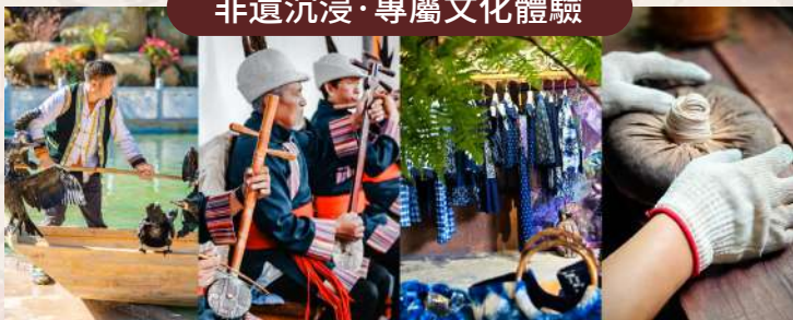
魚鷹捕魚、《白沙細樂》演奏、納西紮染、普洱茶壓製體驗。