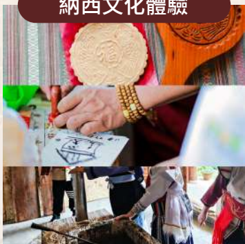
喜餅 / 東巴文 / 造紙術