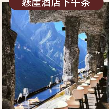
270°玻璃露臺下午茶 (远眺哈巴雪山)