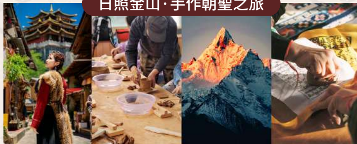
獨克宗藏式旅拍、尼西土陶製作、賞日照金山、手工印製經幡