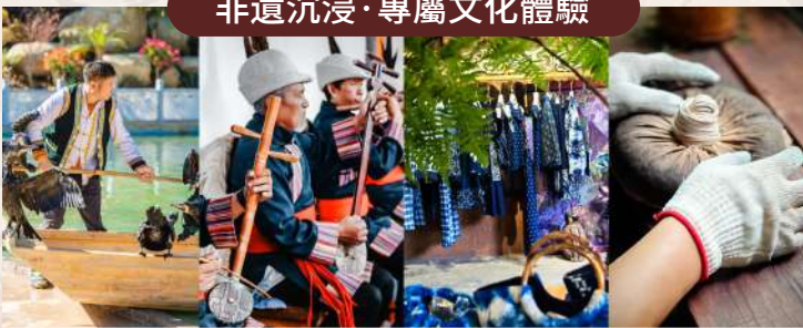
魚鷹捕魚、《白沙細樂》演奏、納西紮染、普洱茶壓製體驗。