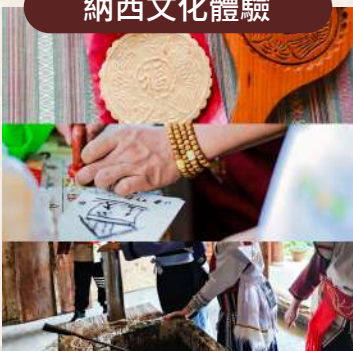
喜餅 / 東巴文 / 造紙術