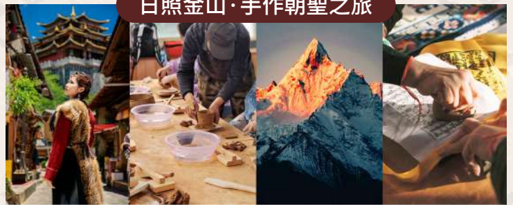
獨克宗藏式旅拍、尼西土陶製作、賞日照金山、手工印製經幡