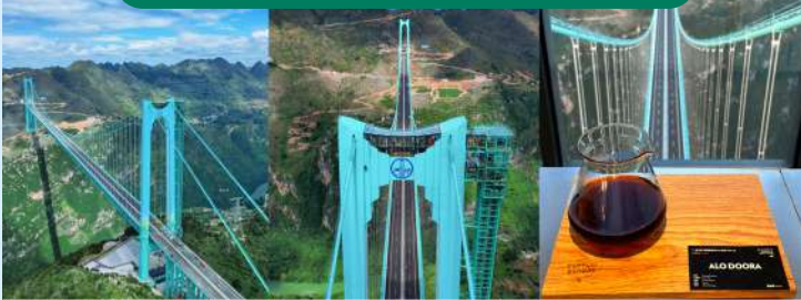
全透明電梯直冲雲霄；高橋塔尖冠軍咖啡打卡