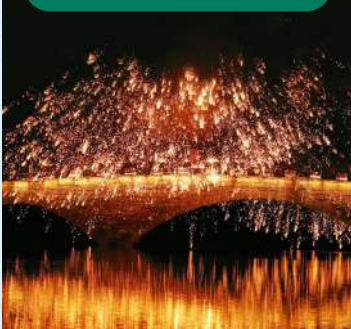
清涼夏夜狂歡，載歌載舞