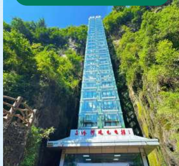
全國第二高室外觀光電梯