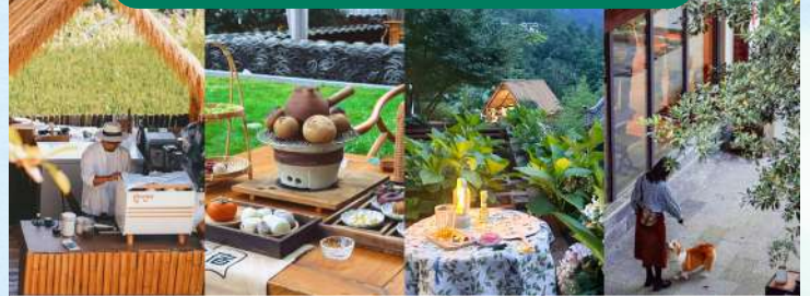
慢享時光 · 民宿特色體驗一站式解鎖