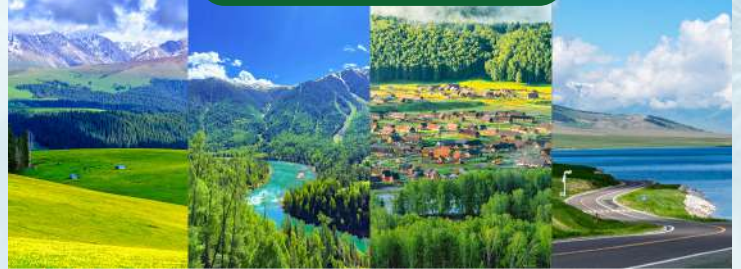
世界級風光全覆蓋：喀拉峻草原、喀納斯、禾木、賽里木湖