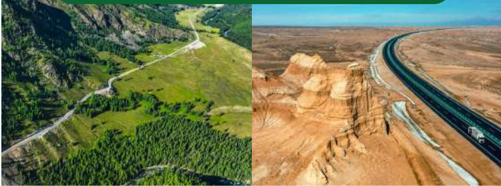
兩條頂級公路，北疆極致風光盡收眼底