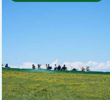
輕鬆上山自在觀景