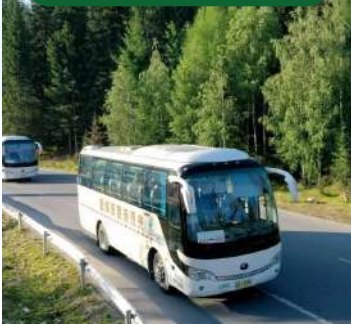
VIP 包車遊覽，省心舒適