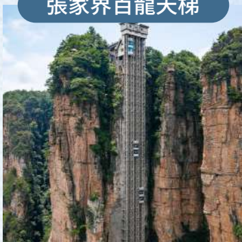
世界最高戶外電梯