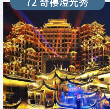
全世界最高的吊腳樓形態建築