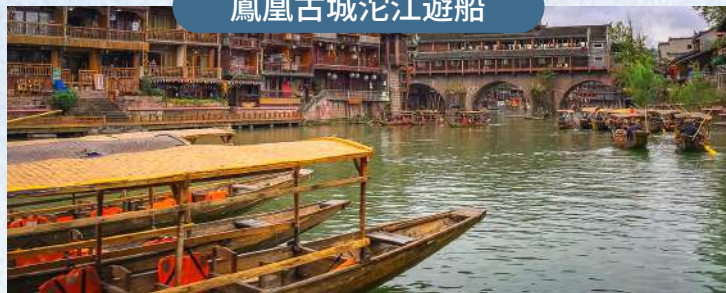
沱江遊船，賞湘西吊腳樓風情