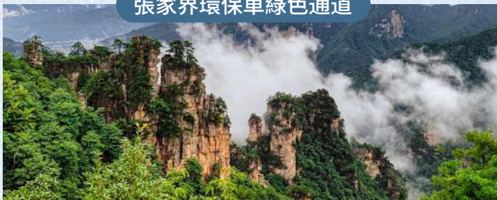
特別包環保車綠色通道，省時省力