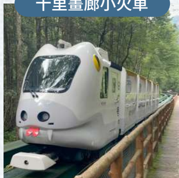
乘小火車遊覽觀三姐妹峯等