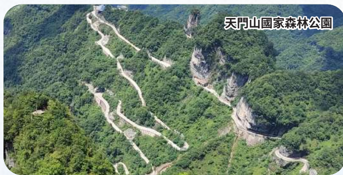
天門山國家森林公園