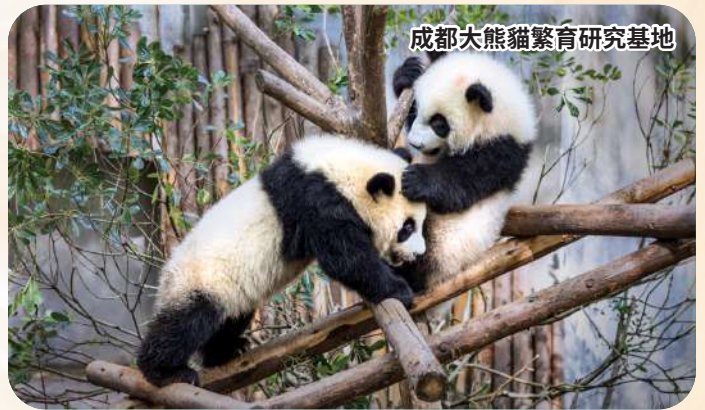
成都大熊貓繁育研究基地