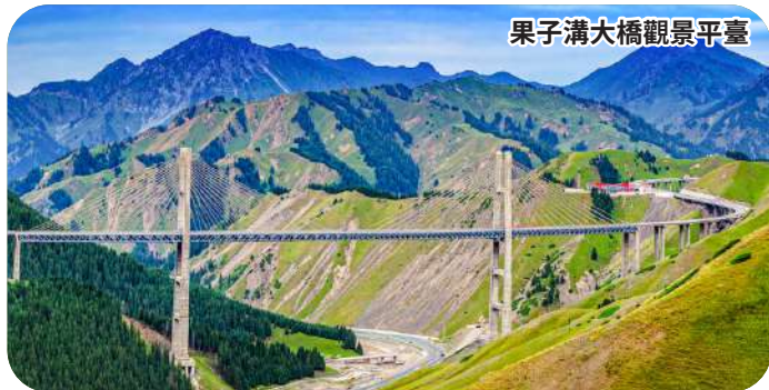
果子溝大橋觀景平臺