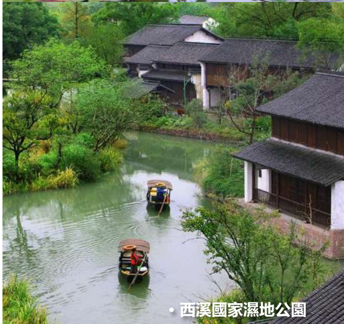
• 西溪國家濕地公園