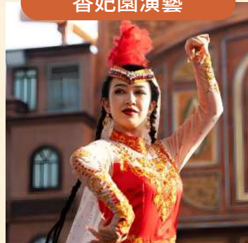
體驗維吾爾族的熱情與浪漫