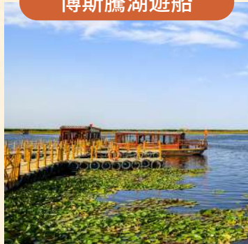
船在湖中行，人在畫中遊