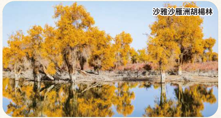
沙雅沙雁洲胡楊林