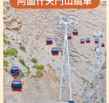
南疆首條高山觀光脫掛式索道