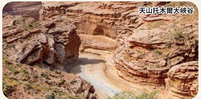
天山托木爾大峽谷