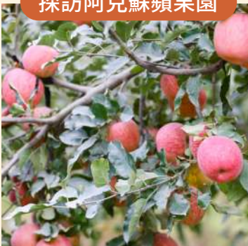
現摘品嘗脆甜冰糖心蘋果