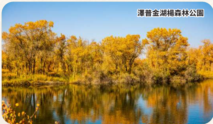
澤普金湖楊森林公園