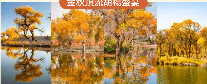
羅布人村寨 + 沙雅原始胡楊林 + 巴楚紅海 + 澤普金胡楊林