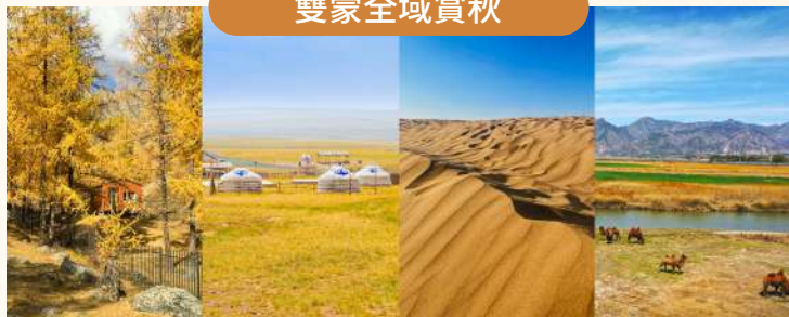
9月金秋限定·雙蒙最美秋景！