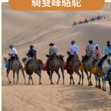
在響沙灣景區，感受大漠風情