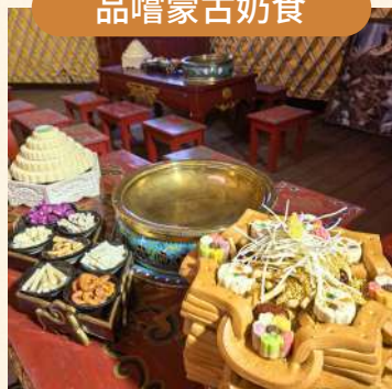
蒙族牧民家庭拜訪