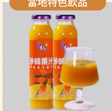
內蒙飲品沙棘果汁