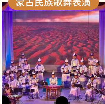
欣賞蒙古藝術魅力