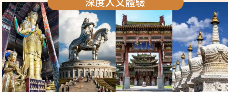
沉浸式感受雙蒙千年底蘊！