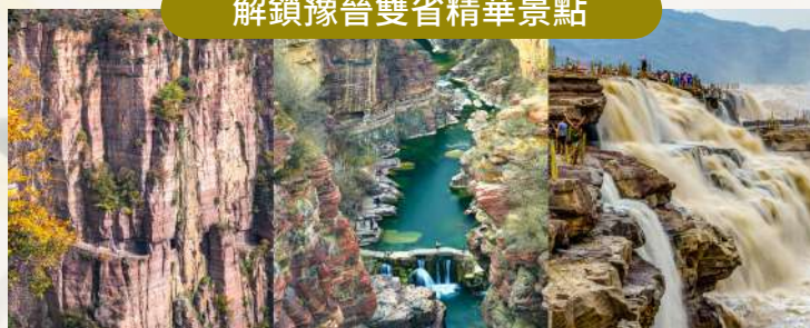
萬仙山掛壁公路 + 雲臺山紅石峽 + 壺口瀑布