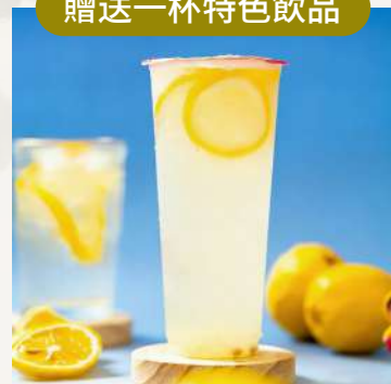
蜜雪冰城總部特色飲品