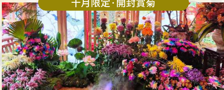
清明上河園沉浸式賞菊