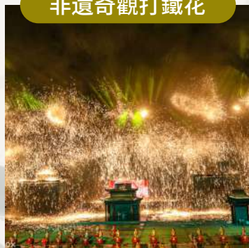
司徒小鎮精彩表演