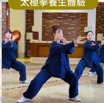
雲臺山麓·大師親授