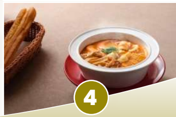
上陽宮主題文化餐