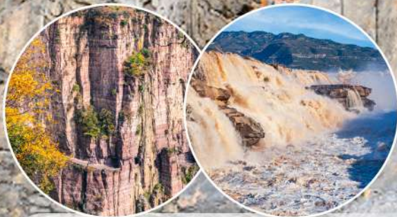
★太行掛壁公路&壺口瀑布