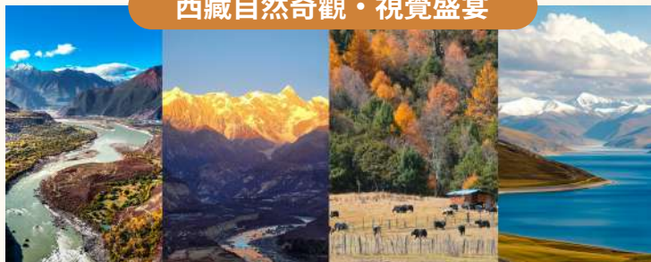
雅魯藏布大峽谷、南迦巴瓦峰、魯朗林海、羊卓雍措