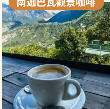
雅魯藏布大峽谷特別安排