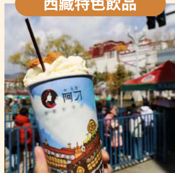
拉薩本土奶茶——阿刁奶茶