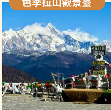
遠眺南迦巴瓦雪山