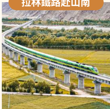
免乘 8 小時長途車程, 旅途更舒適!