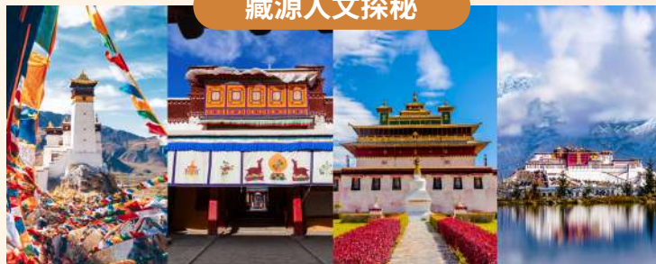
深度解鎖「藏源」歷史!