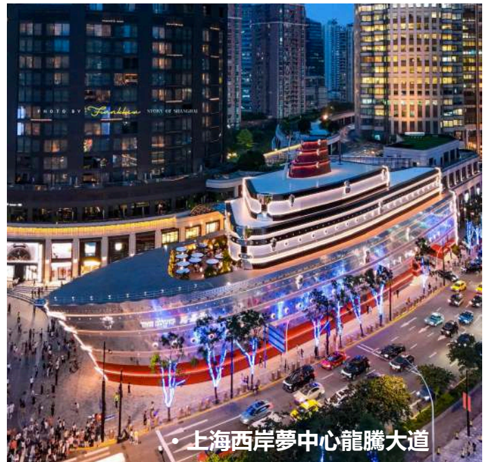
• 上海西岸夢中心龍騰大道

[住宿] ★保證入住【國際奢華品牌五星標準】HYATT ON THE BUND 上海外灘茂悅大酒店