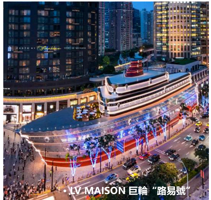
• LV MAISON 巨輪“路易號”

[住宿] ★保證入住【國際奢華品牌五星標準】HYATT ON THE BUND 上海外灘茂悅大酒店