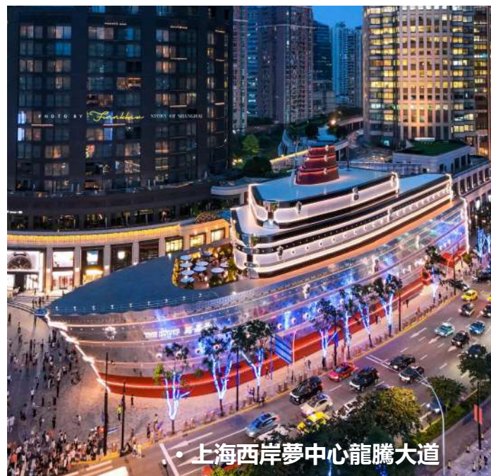
• 上海西岸夢中心龍騰大道

[住宿] ★保證入住【國際奢華品牌五星標準】HYATT ON THE BUND 上海外灘茂悅大酒店