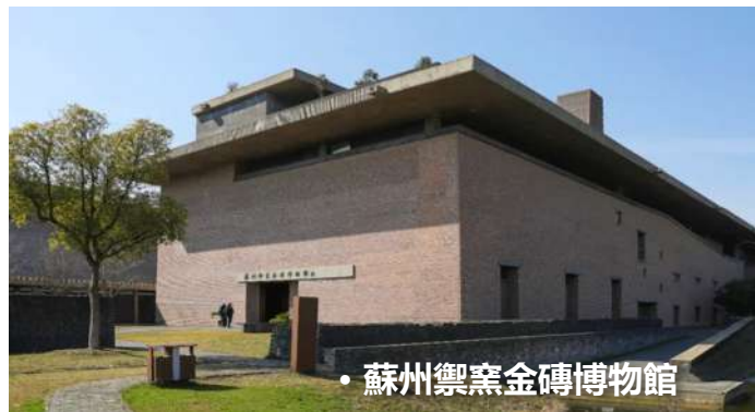
• 蘇州禦窯金磚博物館