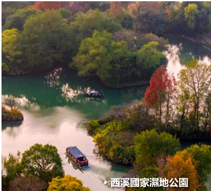
• 西溪國家濕地公園