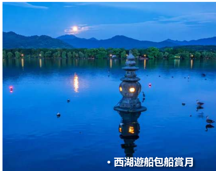
• 西湖遊船包船賞月

[住宿] ★保證入住【西湖景區·國際奢華品牌五星標準】GRAND HYATT 杭州君悅酒店