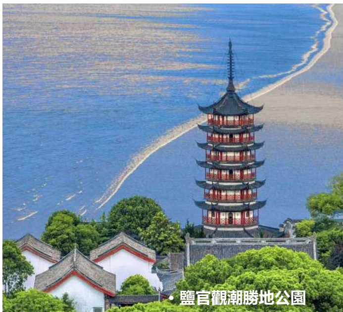
• 鹽官觀潮勝地公園