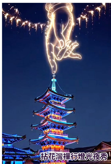
拈花灣禪行燈光夜秀