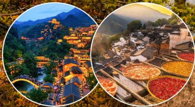
<江南金秋仙境>望仙谷&篁嶺曬秋