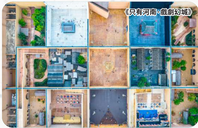
《只有河南·戲劇幻城》