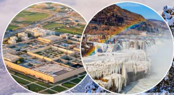
★《只有河南·戲劇幻城》&壺口瀑布