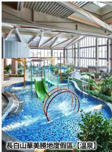
長白山華美勝地度假區【溫泉】