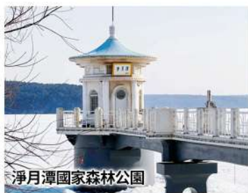
淨月潭國家森林公園