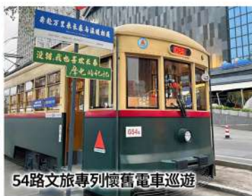
54路文旅專列懷舊電車巡遊