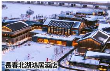
長春北湖鴻居酒店