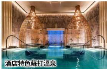
酒店特色蘇打溫泉