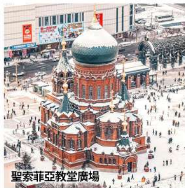
聖索菲亞教堂廣場