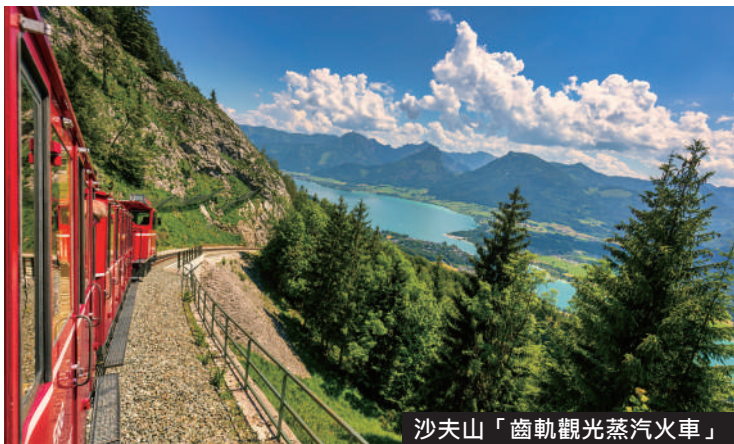
沙夫山「齒軌觀光蒸汽火車」

薩爾斯堡 ~ 寧芬堡(入內參觀) ~ 慕尼黑 ➔ 香港 Salzburg ~ Schloss Nymphenburg ~ Munich ➔ Hong Kong