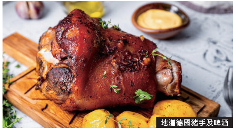
地道德國豬手及啤酒