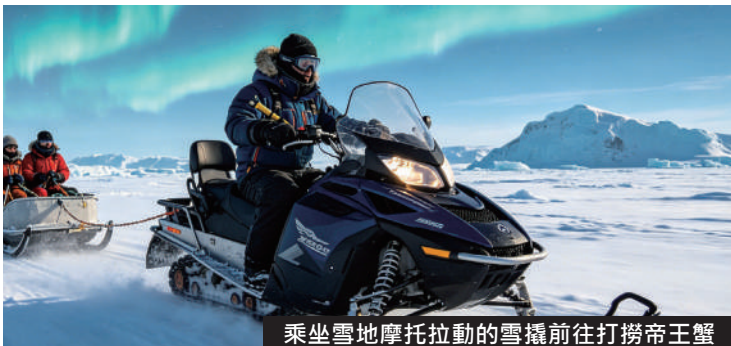
乘坐雪地摩托拉動的雪橇前往打撈帝王蟹